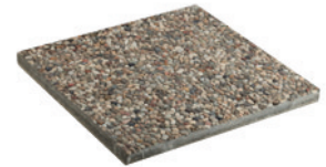
Base in cemento per stabilizzare l'ombrellone