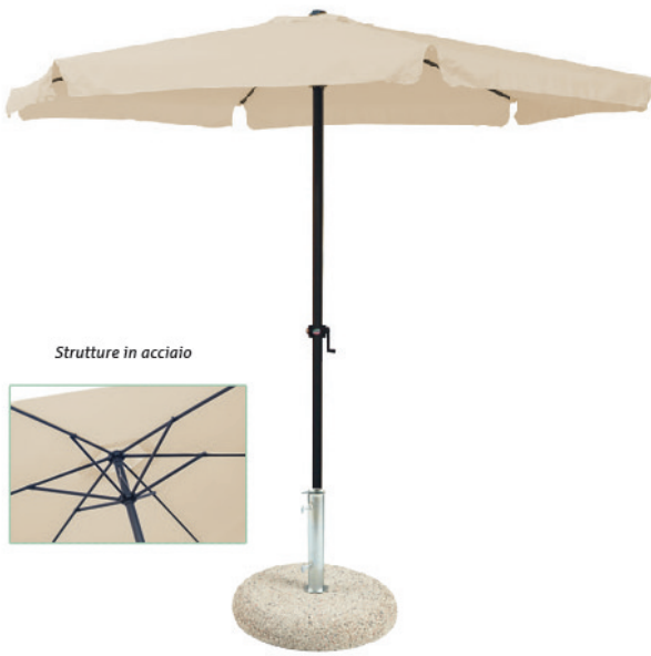
Strutture in acciaio

Prodotti angloamericani soggetti a disponibilità in Italia.